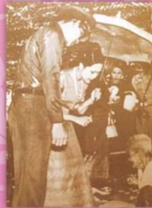
พระองค์เสด็จพระราชดำเนินไปนมัสการ พระพุทธรูปที่วัดคูหาสวรรค์ อำเภอเมืองพัทลุง ทรงเยี่ยมราษฎรที่มาเข้าเฝ้าฯ ท่ามกลางสายฝน