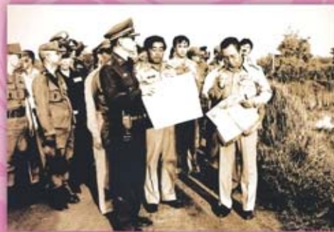
จากแนวพระราชดำริ สู่การพัฒนา พระมหากรุณาธิคุณทรงให้ความสำคัญ แก่การจัดการดินและน้ำที่เป็นหัวใจสำคัญ ของการเกษตรอันเป็นอาชีพของราษฎร ในการจัดการดิน ได้พระราชทานแนวพระราชดำริว่า ต้องอนุรักษ์และปรับดินให้มีความอุดมสมบูรณ์