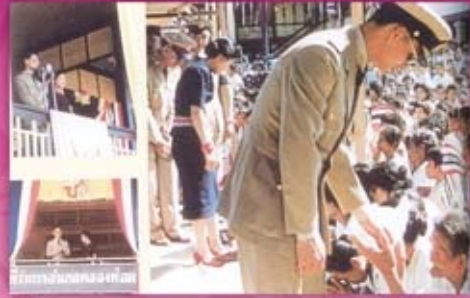
พระบาทสมเด็จพระเจ้าอยู่หัวเสด็จพระราชดำเนิน ไปยังที่ว่าการอำเภอ คลองท่อม จังหวัดกระบี่ และทรงเยี่ยมราษฎรที่มารับเสด็จ มีพระราชปฏิสันถารกับราษฎรอย่างทั่วถึง