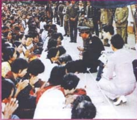
พระองค์เสด็จพระราชดำเนิน ทรงประกอบพิธียกฉัตรทองเจดีย์ วัดช้างให้ อำเภอโคกโพธิ์ จังหวัดปัตตานี