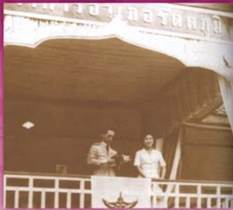
พระองค์เสด็จพระราชดำเนินทรงเยี่ยมเยียนราษฎร จังหวัดสงขลา ทอดพระเนตรกิจการยางที่สถานียางคองส์ ค่ายเสนาณรงค์ และทอดพระเนตรกีฬานักโค