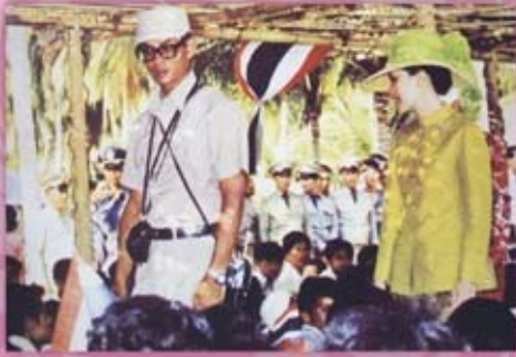
พระบาทสมเด็จพระเจ้าอยู่หัวฯ ทรงมีพระราชดำริ ในการแก้ปัญหาขาดแคลนน้ำของจังหวัดกระบี่ ว่าควรสร้างอ่างเก็บน้ำห้วยน้ำเขียว บริเวณบ้านห้วยยาง หมู่ที่ ๔ ตำบลคลองท่อมใต้ อำเภอคลองท่อม จังหวัดกระบี่ เพื่อจัดสรรน้ำให้พื้นที่เพาะปลูกของราษฎร