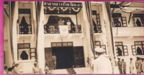
พระองค์เสด็จพระราชดำเนินทรงเยี่ยมราษฎร จังหวัดยะลา เมื่อวันที่ ๒๓ มีนาคม ๒๕๐๒