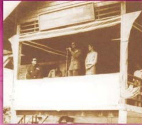
พระองค์เสด็จพระราชดำเนินทรงเยี่ยมเยียนราษฎร จังหวัดสุราษฎร์ธานี หน้าอ่าวหน้าทอน ในวันนั้นน้ำทะเลลดลงอย่างน่าอัศจรรย์ ประชาชนไปยืนรอเฝ้าฯรับเสด็จในทะเล ตามแนวสะพานจำนวนมาก