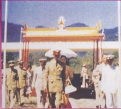
ปี ๒๕๐๒ พลสภานิกขารวระนองต่างปลาบปลื้มเป็นล้นพ้น ที่ทั้งสองพระองค์ได้เสด็จเยี่ยม และได้ทรงลงพระปรมาภิไธย บนก้อนศิลาจารึก ซึ่งตั้งอยู่ตรงเขตแดน ระหว่างจังหวัดชุมพรกับจังหวัดระนอง