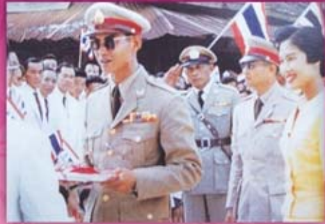
พระองค์เสด็จพระราชดำเนิน ณ พลับพลาธารทัศน์ บริเวณหน้าตึกบาโจ อุทยานแห่งชาติบูโดสสุโขงป่าดี ทรงเยี่ยมเยียนราษฎรบ้านสะแต อำเภอบาเจาะ จังหวัดนราธิวาส