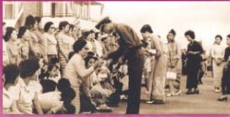
พระบาทสมเด็จพระเจ้าอยู่หัว และสมเด็จพระนางเจ้าฯ พระบรมราชินีนาถ พร้อมด้วยสมเด็จพระเจ้าลูกเธอ ทั้ง ๒ พระองค์ เสด็จพระราชดำเนินไปยังท่าอากาศยานตรง เพื่อเสด็จพระราชดำเนิน ไปทรงปฏิบัติพระราชกรณียกิจ ที่จังหวัดนครศรีธรรมราชและสุราษฎร์ธานี