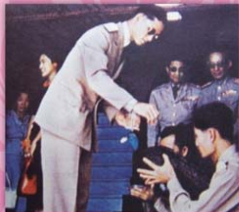
พระองค์เสด็จเยี่ยมเยือนราษฎรจังหวัดกระบี่ และได้ทรงลงพระปรมาภิไธย "ภ.ป.ร. และ ส.ก." ไว้ที่หินปากถ้ำน้ำลอดของธารโบกขรณี