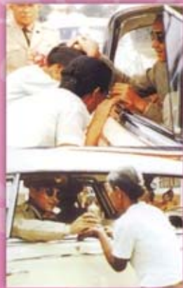
พระองค์เสด็จพระราชดำเนินเยี่ยมราษฎร จังหวัดตรัง