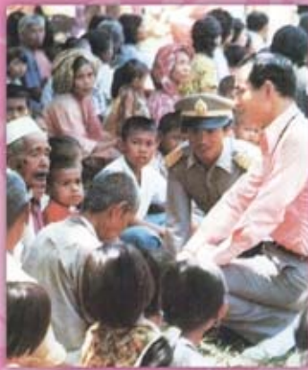
ด้วยพระมหากรุณาธิคุณ แห่งพระบาทสมเด็จพระเจ้าอยู่หัว ได้เสด็จพระราชดำเนินมายังจังหวัดปัตตานี ทรงหาทางแก้ไขด้วยทรงศึกษา วิธีการระบายน้ำขามน้ำหลาก มาเก็บกักน้ำไว้ใช้ยามหน้าแล้ง และแก้ไขปัญหาน้ำกร่อย เพื่อให้ชาวบ้านมีน้ำใช้ในการบริโภค-อุปโภค และเพาะปลูก