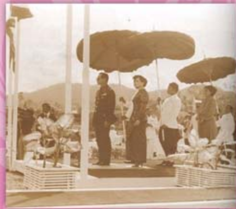
เขื่อนบางลาง จังหวัดยะลา เป็นโครงการพระราชดำริ เพื่อพัฒนาแหล่งน้ำในภาคใต้ และทรงเปิดโรงไฟฟ้าฝายผลิตเขื่อนบางลาง เมื่อวันที่ ๒๗ กันยายน ๒๕๒๔