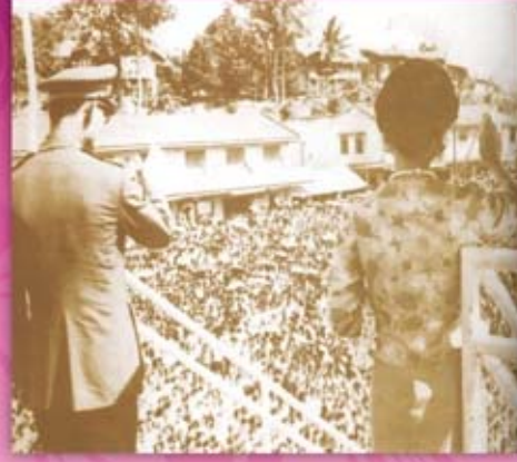
พระองค์เสด็จพระราชดำเนินทรงเยี่ยมเขียนราษฎร จังหวัดภูเก็ต และเมื่อวันที่ ๑๐ มีนาคม ๒๕๐๒ ได้เสด็จเป็นการส่วนพระองค์ทรงดนตรี ร่วมกับวงคณะมิตรศิลป์ของสมาคมนายเหมืองภูเก็ต