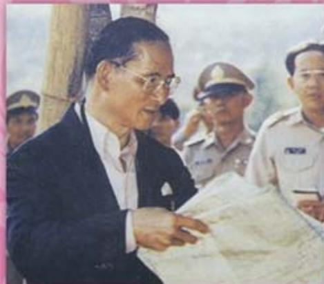
พระองค์เสด็จพระราชดำเนิน ในพิธีพระราชทานพระพุทธรูปราชูปถัมภ์ ประจำจังหวัดนครศรีธรรมราช และทรงเยี่ยมเยียนราษฎร