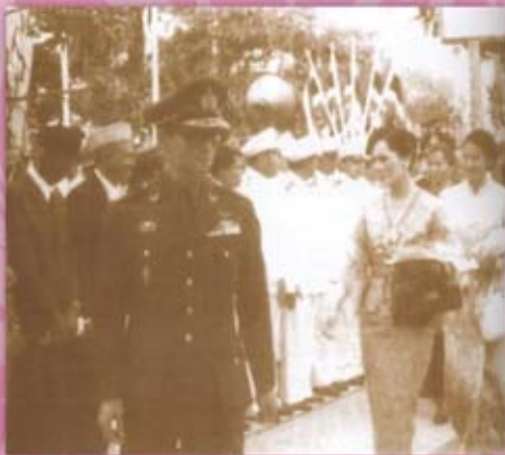
พระองค์เสด็จพระราชดำเนินทรงเยี่ยมเยียนราษฎร จังหวัดสตูล ทรงมีพระราชประสงค์ให้หน่วยงานที่เกี่ยวข้อง จัดระบบในการวางแผน การพัฒนานิคมสร้างตนเองในภาคใต้