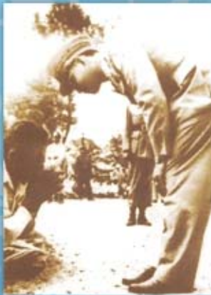
พระองค์เสด็จพระราชดำเนินทรงเยี่ยมเยือนราษฎร อำเภอท่าบ่อ จังหวัดหนองคาย