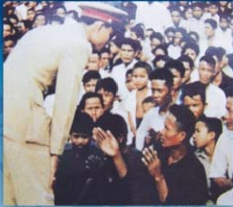
พระองค์เสด็จพระราชดำเนินทรงเยี่ยมเยียนราษฎร จังหวัดมหาสารคาม ซึ่งเป็นจังหวัดที่มีพื้นที่แห้งแล้ง ฝนทิ้งช่วงถึง ๓ ปี แต่พอเสด็จถึง มีสายฝนได้โปรยปราย นำความร่มเย็นมาสู่ภาคอีสาน