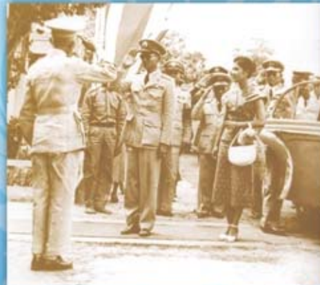
พระองค์เสด็จพระราชดำเนินทรงเยี่ยมเยียนราษฎร จังหวัดร้อยเอ็ด ซึ่งเป็นจังหวัดที่กันดารและขาดแคลนน้ำ ทรงย้ำให้ราชการช่วยเหลือราษฎรให้มากขึ้น