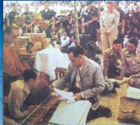
พระองค์เสด็จพระราชดำเนินทรงเยี่ยมเยียนราษฎร จังหวัดยโสธร ทรงประกอบพิธียกข่อฟ้า ตัดลูกนิมิต และทรงปลูกต้นสาละและต้นไทร