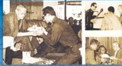
ได้เสด็จพระราชดำเนิน เพื่อทรงนมัสการหลวงปู่ขาว อนาลโย และถวายปัจจัยปัจจัยไทยธรรม ถวายผ้าพระกฐินและสนทนาธรรม จังหวัดอุดรธานี