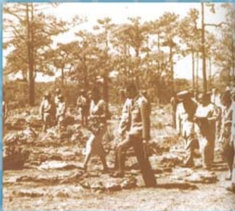
พระองค์เสด็จพระราชดำเนินขึ้นยอดภูกระดึง จังหวัดเลย