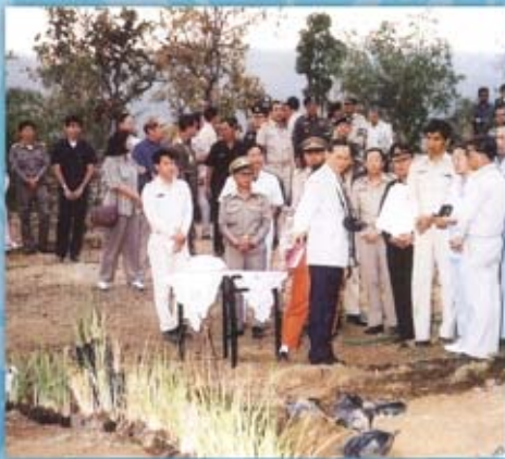
พระบาทสมเด็จพระเจ้าอยู่หัวพระราชดำเนิน ณ จังหวัดขอนแก่น เมื่อวันที่ ๑๕ ธันวาคม ๒๕๓๙ ทรงมีโครงการพระราชดำริ ซึ่งส่วนหนึ่ง คือ การปลูกหญ้าแฝกเพื่อการอนุรักษ์ดินและน้ำ