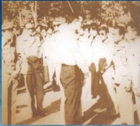
พระองค์เสด็จพระราชดำเนินแปรพระราชฐาน ประทับแรมปฏิบัติพระราชกรณียกิจ ณ จังหวัดสกลนคร ด้านการพัฒนาแหล่งน้ำ การพัฒนาด้านการเกษตร ด้านการศึกษาและด้านพระพุทธศาสนา