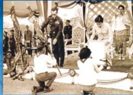
พระบาทสมเด็จพระเจ้าอยู่หัว และสมเด็จพระนางเจ้าฯ พระบรมราชินีนาถ พร้อมด้วยสมเด็จพระเทพรัตนราชสุดาฯ ทรงเสด็จพระราชดำเนินมายัง จังหวัดร้อยเอ็ด เพื่อทรงพระราชทานธงประจำรุ่นลูกเสือชาวบ้าน มีลูกเสือชาวบ้านกว่า ๓๐๐ รุ่น