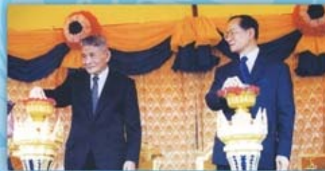
พระองค์เสด็จพระราชดำเนิน มายังจังหวัดหนองคาย เพื่อทรงเป็นประธานในพิธีเปิดสะพานมิตรภาพ ที่เชื่อมฝั่งโขงไทย-ลาว ร่วมกับ ฯพณฯ หนุ่ยฮัก ทุมสะหวัน ประธานประเทศสาธารณรัฐ ประชาธิปไตยประชาชนลาว