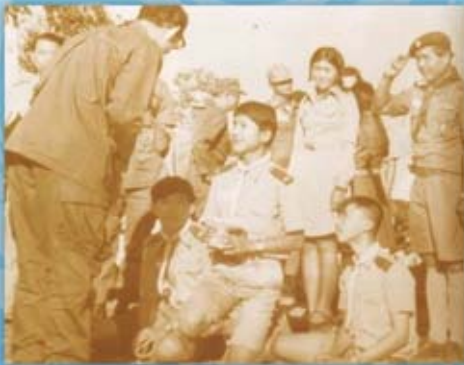
ปี พ.ศ. ๒๕๑๖ พระบาทสมเด็จพระเจ้าอยู่หัว ทรงมีพระดำริให้สร้างโรงเรียน ในพื้นที่ที่มีปัญหา ในจังหวัดมุกดาหาร และพระราชทานนามโรงเรียนว่า "โรงเรียนร่มเกล้า"