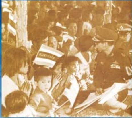
เสด็จพระราชดำเนินทรงเยี่ยมเยียนราษฎร จังหวัดอำนาจเจริญ ทรงประทับนั่งพับเพียบลงกับพื้นดินใกล้ชิดกับราษฎร โดยไม่มีลาดพระบาทรองรับและมีได้ถือพระองค์