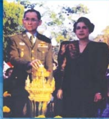
พระองค์เสด็จพระราชดำเนิน ทรงเปิดพระบรมราชานุสาวรีย์ และศาลสมเด็จพระนเรศวรมหาราช ณ สนามเรศวร จังหวัดหนองบัวลำภู