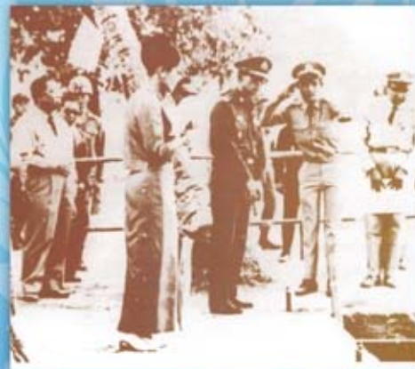
พระองค์เสด็จพระราชดำเนินไปยังบ้านเชียง อำเภอหนองหาน จังหวัดอุดรธานี เพื่อทอดพระเนตรบริเวณแหล่งขุดค้นโบราณคดี สมัยก่อนประวัติศาสตร์